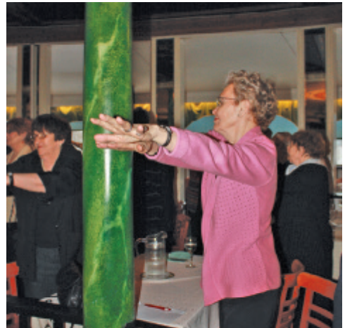
Pieni venyttelytuokio virkisti kehoa ja aivoja.

”Työ on keventynyt. Kipu samoin kuin köyhyys ovat lieventyneet. Vahvojen vallan käyttö on vähentynyt. Tasa-arvo ja turvallisuus ovat lisääntyneet, samoin vapaus. Matkanteko on helpottunut, ja elämä on kiireetömämpää. Valinnan mahdollisuuksia on paljon”, onnellisuusprofessori luutteli.