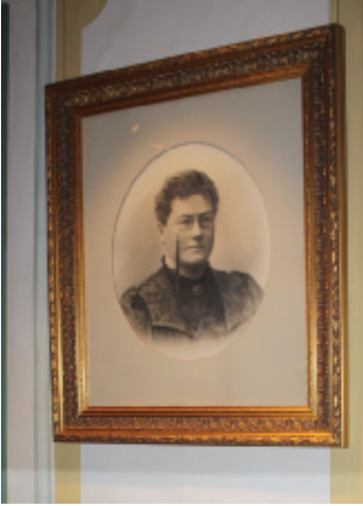
Naisasia-aktivisti Aleksandra Gripenberg perusti vuonna 1911 Suomen Naisten Kansalliliiton, nykyisen Suomen Naisjärjestöjen Keskusliiton.

Suomen naisellisin näyttely löytyy Helsingistä Suurtorin kupeesta.