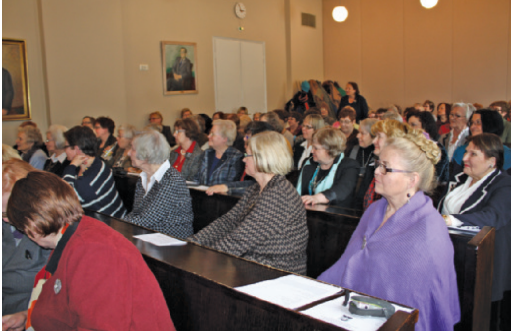
Helsingin yliopiston luentosali täyttyi huhtikuun alussa feminismistä kiinnostuneista naisista.