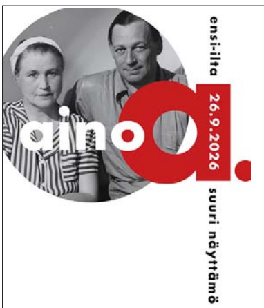
Valokuva Herbert Matter. Julisteen graafinen suunnittelu Eija Haukka

Syyskaudella jäsenemme osallistuvat aktiivisesti myös Suomalaisen Naisliiton valtakunnallisiin tapahtumiin ja Vilkema-säätiön järjestämiin tilaisuuksiin, joko yksilöinä tai pienryhmissä. Päätämme syyskauden osastomme pikkujouluhin. Tapahtumista ja tilaisuuksista tiedotetaan jäsenille sähköpostilla ja kirjeitse niille jäsenille, jotka eivät käytä sähköpostia.