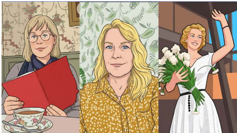
Pohjoisen Naiset- Naisten Ääni 2.0 -kirjaseinän kuvitusta

Perheet saivat kupillisen suomen kielen harjoittelua ja me oululaiset kupilliset kulttuuritietoutta ja heidän valmistamia maistiaisia.