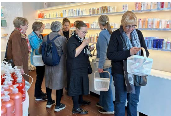
Dermosilin tuotteet kiinnostivat jäsenillässä.

Vaasan Suomalaisen Naisklubin kevätkausi on loppusuoralla. Tuorein jäsenilta oli 19.5., jolloin klubilaiset kävivät tutustumassa Dermosilin liikkeeseen Vaasan Palosaarella. Suomalainen, Korsnäsissä vuonna 1983 perustettu yritys valmistaa ihonhoitotuotteita herkälle iholle sekä hiustenhoitotuotteita ja meikkejä.