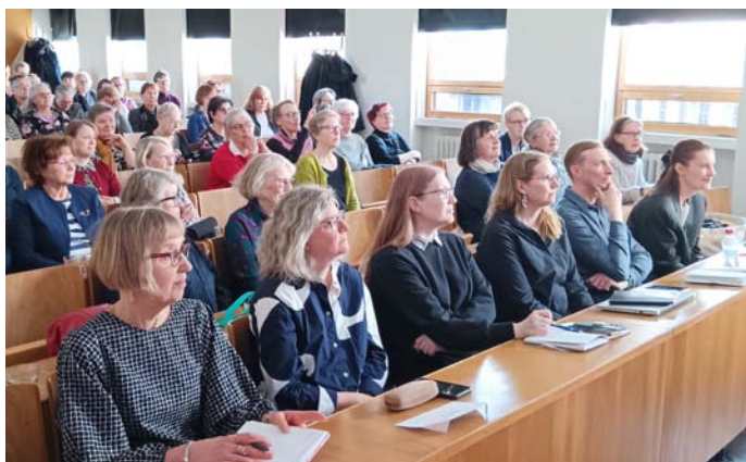
Metsätalon luentosali oli täynnä kiinnostuneita kuuliijoita.

kun naisten asema urheilun kentällä on vahvistunut. Naiset ovat siirtyneet naisjaostoista urheilujärjestöjen ytimeen aktiivisiksi toimijoiksi ja päätöksentekijöiksi.