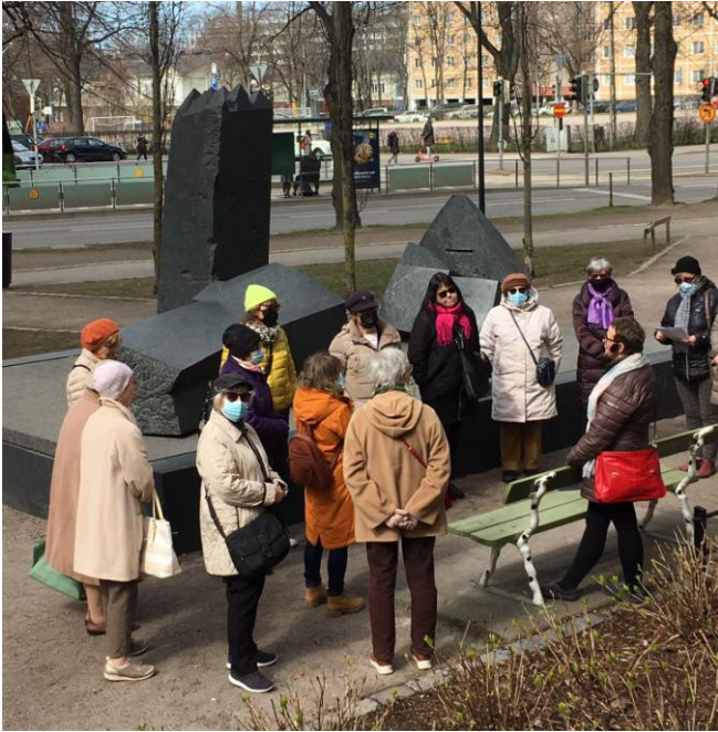
Helsingin yhdistys kävelykierroksella Töölössä.