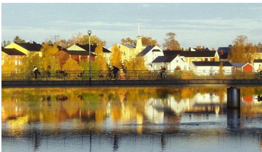
Oulun Pikisaari pyörätiesillan taustalla.