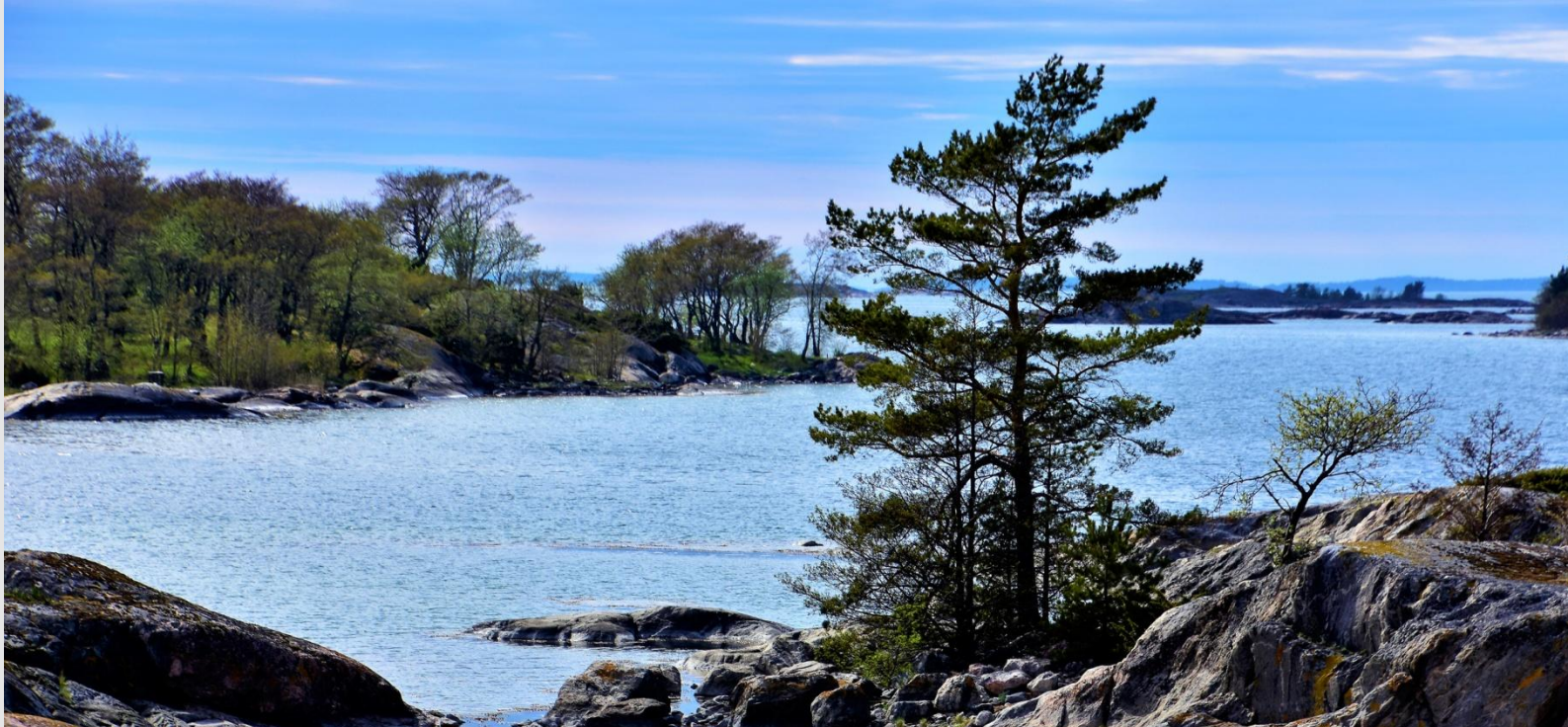
Saaristo herää kevääseen.