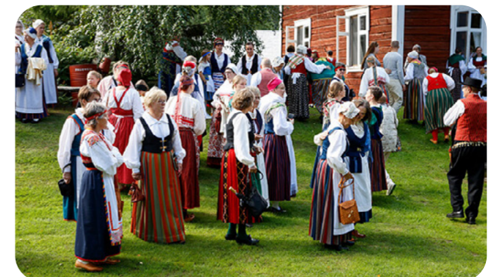
Oulun Kalevalaisten kansallispuikutuuletuksessa elokuussa 2024 nähtiin upeita kansallispujukuja.