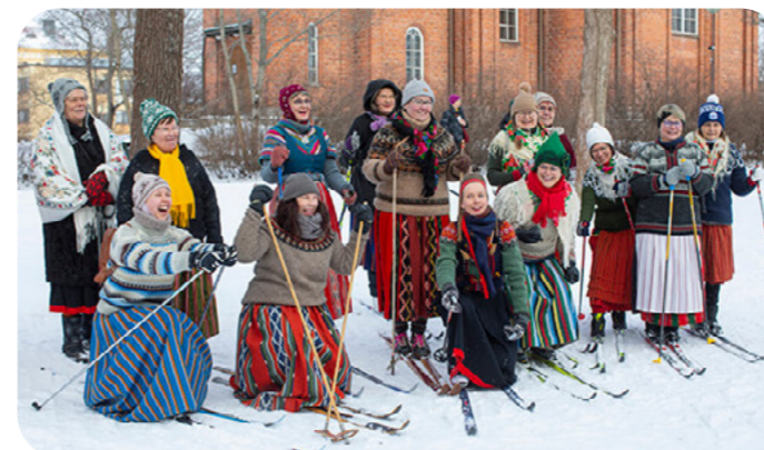
Kansallispukihiihdon tunnelmaa: Vaasan Kalevalaisten iloinen joukko lähdössä ladulle Kasarminpuistossa 16.2.2025.

Kesällä 2024 yhdistys teki matkan silloiseen Euroopan kulttuuripääkau- punkiin Tarttoon. Matkalle osallistui oululaisten lisäksi kalevalaisia muis- ta jäsenyhdistyksistä. Kokemus oli kiinnostava, etenkin, kun Oulun kau- punki ja sen lähikunnat parhaillaan valmistuvat tulevaan Euroopan kulttuuripääkaupunkivuoteen 2026.