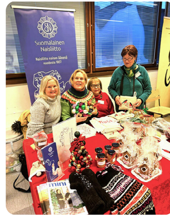
Vuosi 2024 päätettiin Oulussa mukaviin tunnelmiin osallistumalla joulumessuille. Myytävänä oli yhdistyksen jäsenten leipomia joululeivonnaisia sekä käsitöitä ja joulukoristeita.

Olemme käynnistämässä Naisten Ääneen liittyvää kaksivuotista