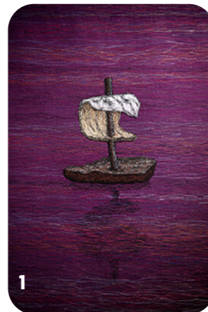
1. Violetti antependium eli alttarin etuosan peittävä kirkkotekstiili, Luomaniemen kappeli 2. Haminan kirkon messukasukka.