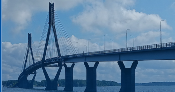
Raippaluodon silta.

Tutustumme mm. TV:stä tuttuun Strömsöhön ja UNESCON maailmanperintöalueeseen Raippaluodon saaristossa sekä vaasalaisiin, rajoja rikkoneisiin naistaiteilijoihin ja Vanhan Vaasan historiaan.