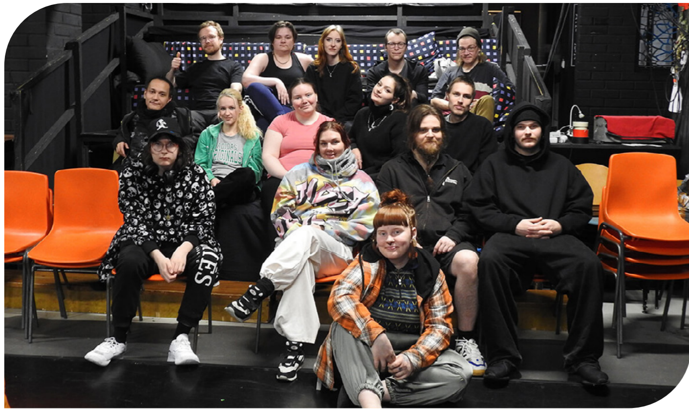
Legioonateatterin työpajoissa nuoret harjoittelevat ja valmistautuvat uuden näytelmän ensi-iltaan.