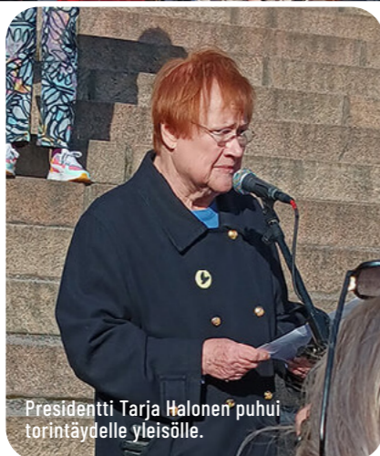
Presidentti Tarja Halonen puhui torintäydelle yleisölle.

”RAKKAUDELLA JA RAIVOLLA KAIKKIEN NAISTEN PUOLELLA”