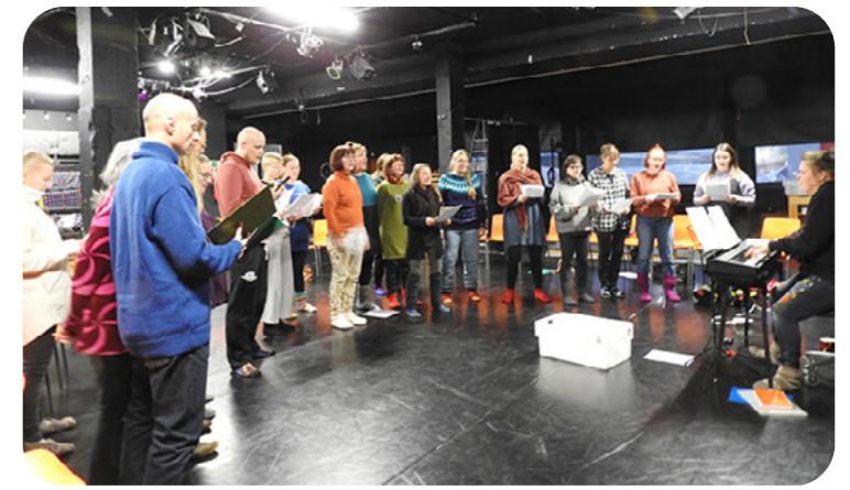
Rauhankuoro koolla. Laulu luo toivoa ja yhteisöllisyyttä.

– Olen ollut monessa pajassa, joissa jokainen tehnyt vain omaa juttuaan. Tämä on ainoa paja, jossa tekemisen kautta ryhmäytyy. – Omien tavoitteitten lisäksi yhteiset tavoitteet tukevat ryhmäytymistä. – Kun on esitys, on vastuu tulla pajalle, kun tietää että porukka odottaa. – Ohjelma on suunniteltu hyvin. – Kun seuraa muita, oppii ihan kauheasti, mitä on tiimi. – Tämmöisiä paikkoja pitäisi olla enemmän. –Yksi taika on siinä, että tänne ei voi tulla nonstoppina, vaan on kaksi aloitusta; mennään sillä porukalla, tehdään tiettyyn aikaan tiettyjä asioita, kaikki tekevät kaikkea; sitoudutaan siihen, että tehdään. – Täällä tuntuu, että