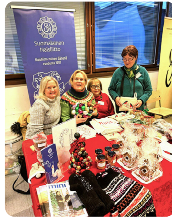
Vuosi 2024 päätettiin Oulussa mukaviin tunnelmiin osallistumalla joulumessuille. Myytävänä oli yhdistyksen jäsenten leipomia joululeivonnaisia sekä käsitöitä ja joulukoristeita.

Olemme käynnistämässä Naisten Äänen liittyvää kaksivuotista