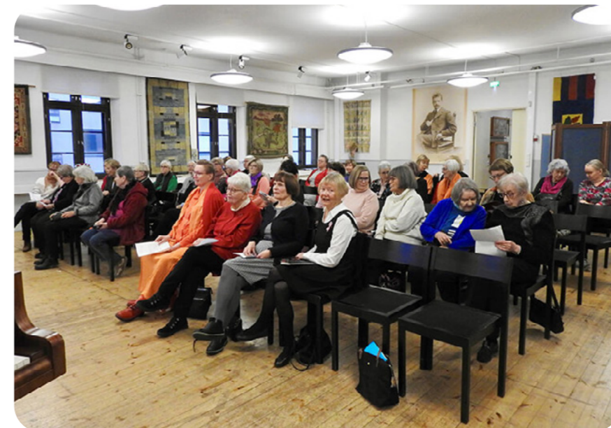
Hämeenlinnan yhdistys järjesti marraskuun lopussa Viikemaa-päivän Hämeenlinnan vanhassa kutomossa, yhdessä Opetusneuvos Hilja Viikemaa Stipendisäätiön kanssa. Paikalle saapui salintäysi naisliittolaisia.

Kunta- ja aluevaaleihin valmistaudumme uusien verkostokumppaneiden kanssa. Olemme lyöttäytyneet yhteen Hämeenlinnan Akateemisten Naisten ja Hämeenlinnan Yrittäjän naisten kanssa. Kutsumme puolueiden naisedustajia keskustelemaan kuntavaaleihin liittyvistä teemoista ja pidämme yllä keskustelua saavutettavuudesta, digipudokkuudesta, tasa-arvosta ja yhdenvertaisuudesta sekä kulttuurin